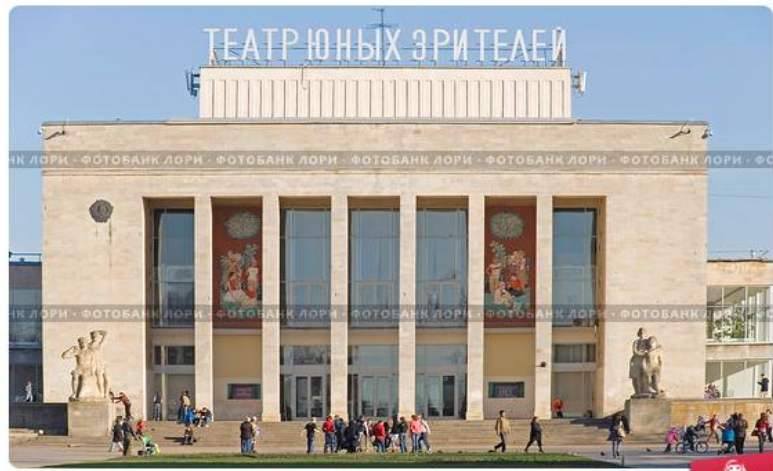
Театр юных зрителей. Санкт-Петербург.